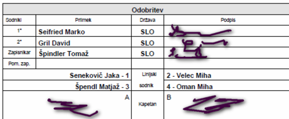
Slika 17 Potrđitev rezultata tekme in zapisnika